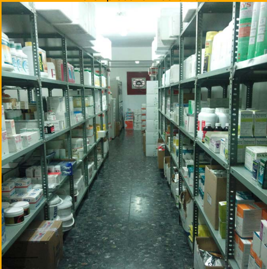
Almacén productos Zoonosanitarios

Cumplimos con todas las autorizaciones pertinentes para la distribución y almacenamiento de productos zoonosanitarios según el Real Decreto 109/1995 (Ley 25/1990 del 20 Diciembre) Nº Registro: SE-32